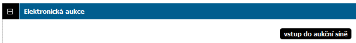
Obrázek 11 - Vstup do aukční síně

Do doby ukončení příslušné elektronické aukce je možné do aukční síně přejít jednoduše pomocí tlačítka vstup do aukční síně v bloku „Elektronická aukce“.